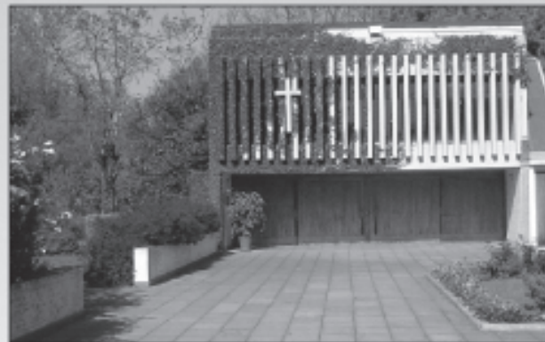
Capilla Pablo Nogués